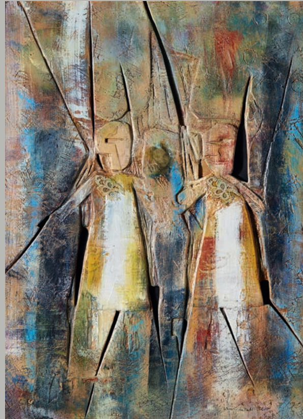
Child brides in Afghanistan | bruno da Todi

More information in the book „Stelle e pane“ by J+J Lindner