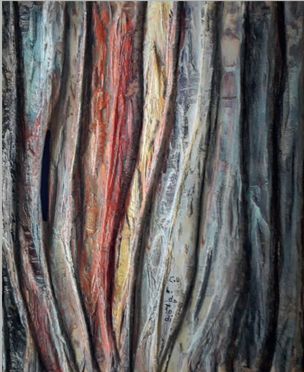
Hiroshima-Nagasaki-Fukushima | bruno da Todi

Vivre et travailler à Nuremberg, la ville des droits de l'homme, revêt une importance particulière pour l'artiste.