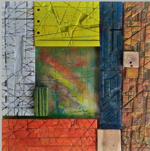
Fenster zum Universum | bruno da Todi