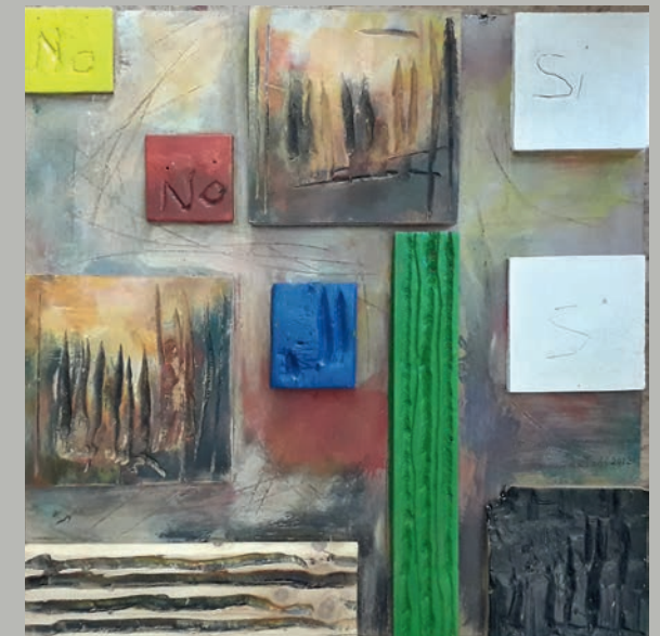
Fake news | bruno da Todi