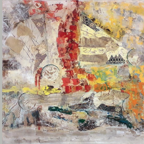
Victims among victims | bruno da Todi